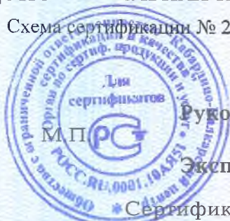
Схема сертификации № 2.